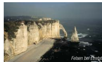
Felsen bei Etretat

Jahr für Jahr bietet sie dem Jet-Set sowie bekannten Stars und Sternchen ein Feriendomizil par excellence. Der Geruch von frischen Äpfeln, das Rauschen des